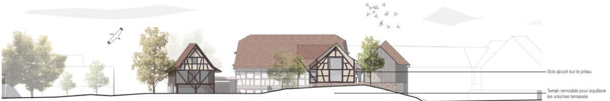
façades Est 1/250°