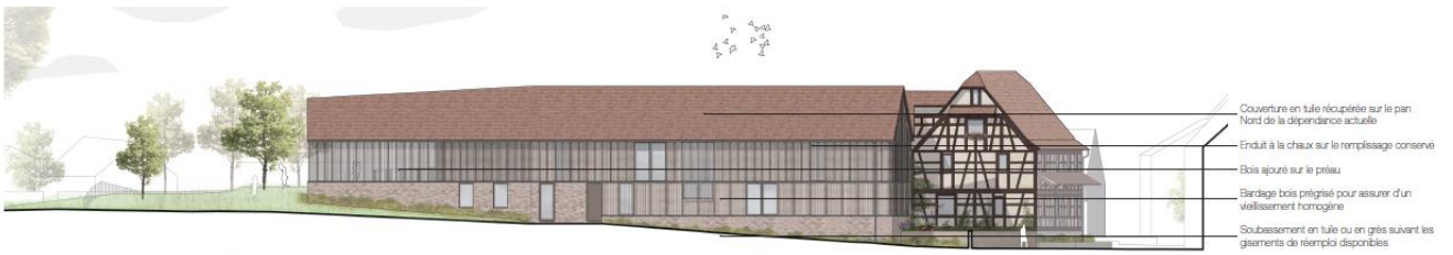
façades Nord de l'extension et de la maison Becker 1/250°