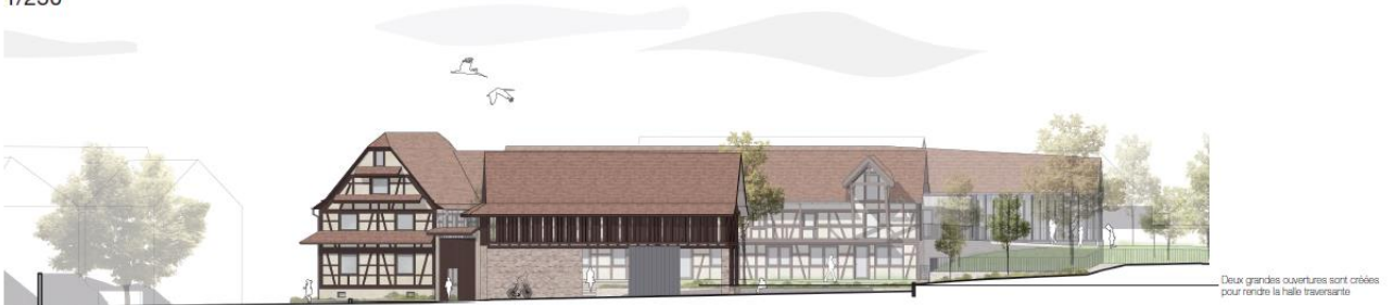
façades Sud sur la halle 1/250°