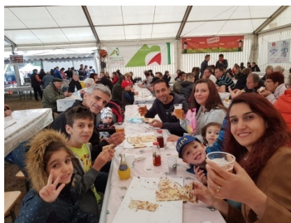
Acclimatation alsacienne à Brumath (mai 2018)

L'espoir redonné à des êtres humains (petits et grands) qui ont dû fuir un pays en guerre depuis plus de 7 ans, l'espoir pour ces personnes accueillies de pouvoir reconstruire quelque chose ayant tout perdu dans leur « Heimat »,