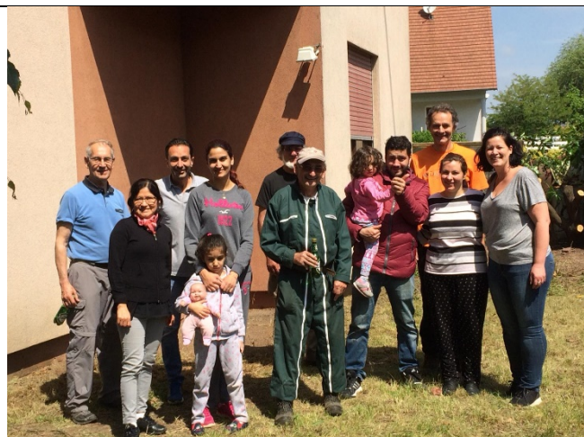
Travaux avant installation à Hoerdt (mai 2018)

Toute aide est la bienvenue : temps de présence pour aider à apprendre le Français ou faire découvrir la région, assurer les déplacements pour les courses ou RDV divers, don financier (délivrance d'un reçu fiscal) pour notre participation aux charges mensuelles des ménage