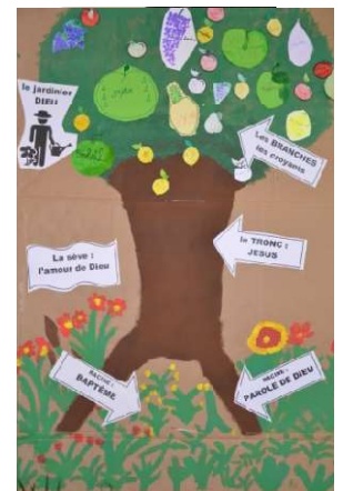
arbre de vie des enfants (Ecole du dimanche)