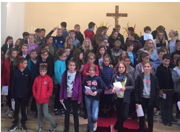
une partie de la chorale des enfants en répétition

Comme annoncé, depuis cette rentrée, les groupes de catéchisme de plusieurs paroisses se sont rapprochés pour poser les bases et expérimenter une formule commune de catéchisme.