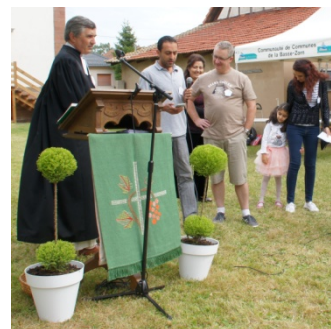
Prise de parole de M. Alaridi à la fête paroissiale le 27 juin 2018

L'espoir , enfin, de réussir à accompagner vers l'autonomie ces frères et sœurs en humanité afin qu'ils puissent s'intégrer dans notre société et tout simplement ... VIVRE.