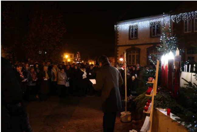
Bougies de l'Avent / 27.11, 4.12, 11.12 et 18.12.

Cette année un nouveau projet a vu le jour, à l'initiative de la municipalité de Gries. Pour marquer ce temps de l'Avent, y compris dans sa symbolique chrétienne, quatre temps d'allumage des bougies ont eu lieu sur la place de la mairie, les quatre dimanches du temps de l'Avent.