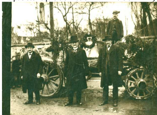
Arrivée de la nouvelle cloche à Kurtzenhouse

Elle porte l'inscription : « Kurtzenhausen 1925 - Moi Margarethe promet solennellement de remplacer avec dignité ma sœur de nom, qui m'a précédée et qui fut réquisitionnée par les Allemands pendant la guerre en 1918 » (n.b la cloche précédente n'a pas été réquisitionnée en 1918 mais en 1917)