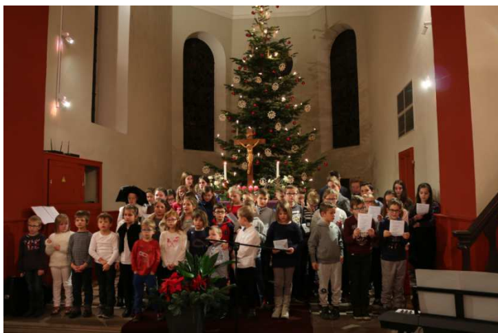
Rassemblés pour chanter ! 21 décembre 2016

La belle fête Noël des enfants, avec les enfants de l'Ecole du Dimanche, des enfants des écoles et des jeunes du catéchisme, s'est déroulée en l'église de Gries le 21 décembre. La saynète « Noël, partout et pour tous » rappelait que l'enfant Jésus, né pour tous, ne fait pas de différence entre les personnes, quelque soit leur origine ou leur lieu de vie.