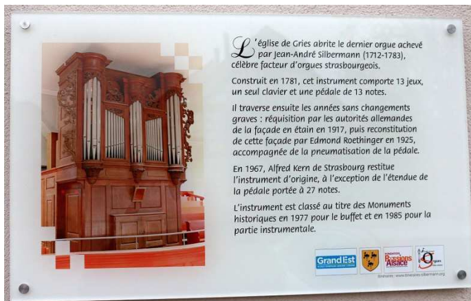
Le nouveau panneau sur l'église de Gries de l'association http://itineraires-silbermann.org/