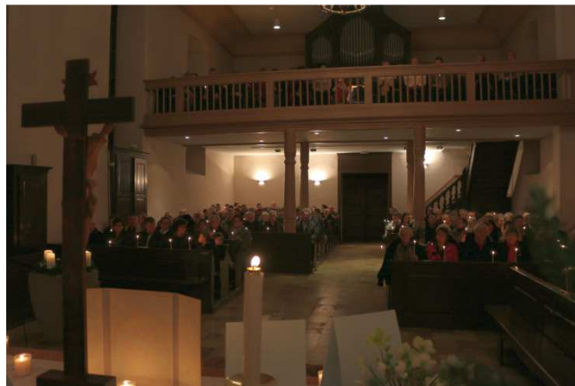
Veillée de Noël – église de Kurtzenhouse