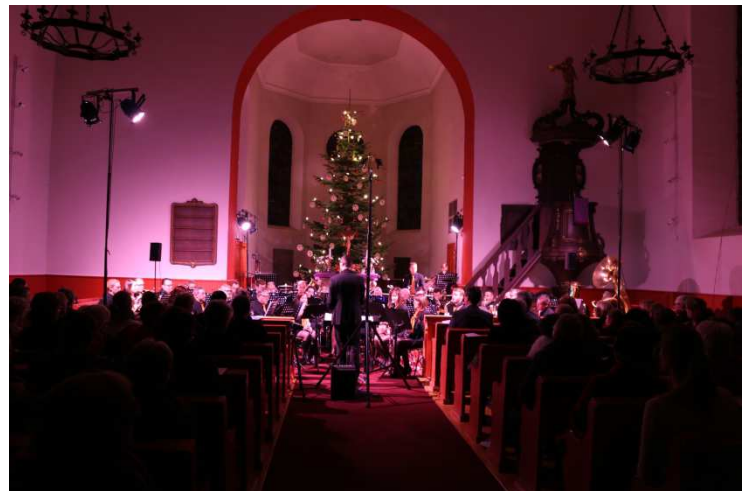
18 décembre 2016 - Concert de Noël

Le dorénavant traditionnel concert de Noël de la Musique Municipale de Gries a eu lieu cette année à l'église protestante de Gries. Un très beau moment musical de qualité dans une église bien pleine avec des variations de lumière pour donner encore plus de profondeur aux morceaux musicaux. Après cette magnifique prestation tout le monde s'est retrouvé place de la mairie pour le moment d'allumage de la dernière bougie de l'Avent et partager un moment de convivialité autour d'un vin chaud offert par la MMG.