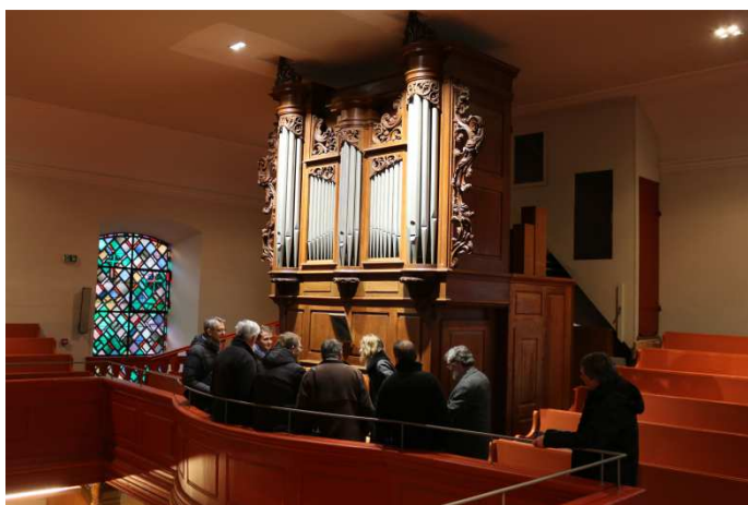
15 janvier 2017

Depuis janvier 2016, notre paroisse est adhérente à l'association « Itinéraire des orgues Silbermann », association dont le but est de valoriser les lieux qui possèdent un orgue Silbermann.